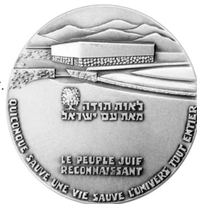
Médaille des Justes de Yad Vashem

Il ordonne la lecture publique le 23 août 1942 dans son diocèse d'une lettre pastorale restée célèbre dans laquelle il affirme : « les Juifs sont des hommes, les Juives sont des femmes... Tout n'est pas permis contre eux... Ils font partie du genre humain. Ils sont nos frères comme tant d'autres. Un chrétien ne peut l'oublier. ». Bien qu'interdite par arrêté préfectoral, la lecture de cette lettre a quand même lieu dans la plupart des paroisses et surtout, sera reprise et diffusée sur les ondes de la BBC à Londres.