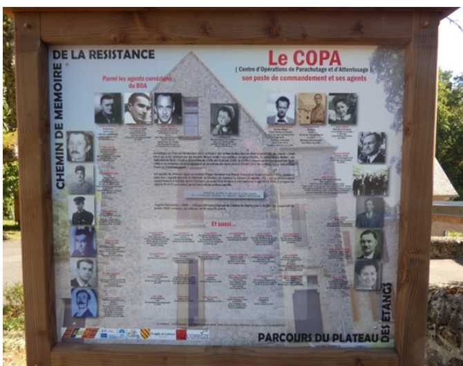
Panneau dédié au réseau COPA corrèzien à Saint-Pardoux-la-Croisille

Chaque « COPA » choisissait ses terrains de parachutages et d'atterrissage où il recevait l'aide matérielle des Alliés (armes, vivres, habillement). Des instructeurs y étaient parachutés pour créer des écoles d'instruction d'armement et de sabotage (de lignes électriques, de voies ferrées, d'usines dont l'activité servait l'occupant...). Des spécialistes « radio » y installaient des émetteurs et transmettaient les informations sur les mouvements de l'ennemi. Le COPA développe ses camps dans notre secteur dès septembre 1942 où les réfractaires du STO trouvent refuge, comme dans les bois du Quinsac, à Combenègre, à Bassignac-le-Haut, à Clergoux... Autant d'hommes et de femmes qui ont participé à la lutte et à la Libération de la France.